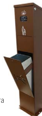
Dispensador + Papelera